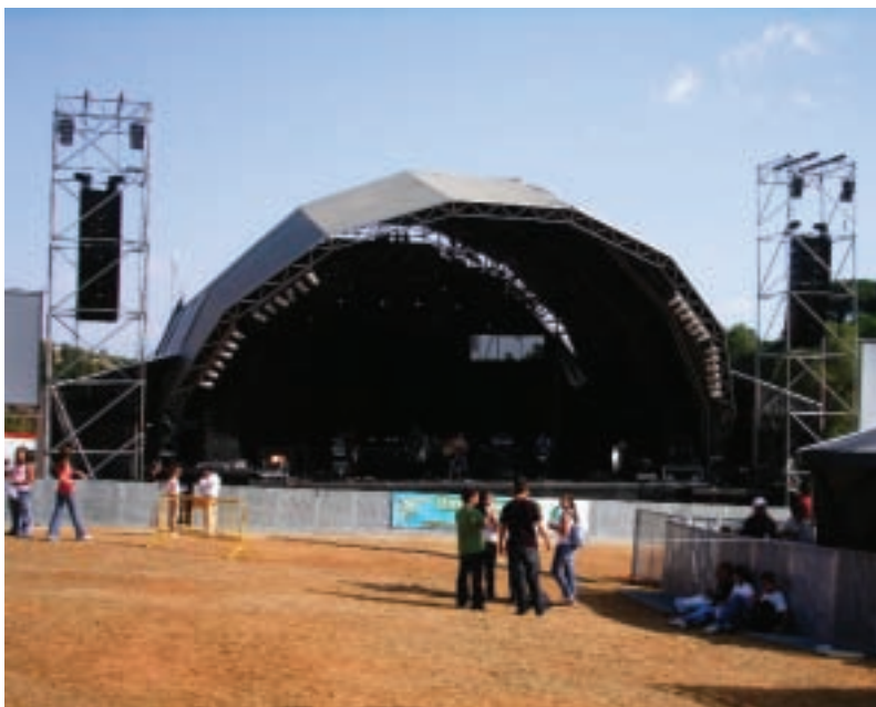
O palco durante os ensaios

Teve lugar em Vaqueiros (Santarém) o festival “Life Experiences in Alviela”, de 24 a 26 de Agosto.