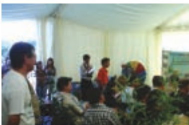
O stand dedicado às questões ambientais foi dos mais movimentados