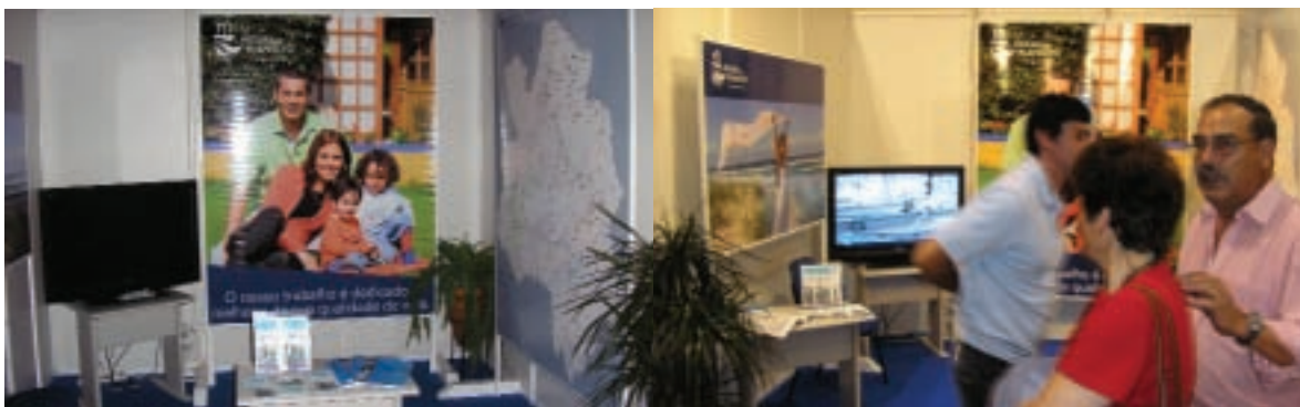
O stand da Águas do Planalto

A FICTON 2007 – Feira Industrial e Comercial de Tondela teve lugar de 13 a 16 de Setembro. Tal como nos anos anteriores, esta Feira constitui uma grande mostra das actividades sócio-económicas do Concelho e região envolvente, sendo ponto de