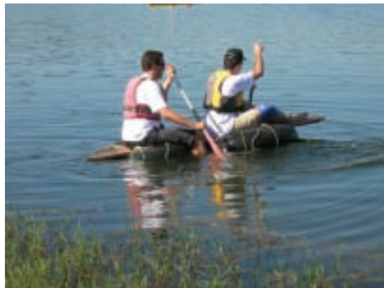
Uma das jangadas construídas