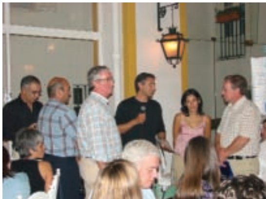
Os mais antigos