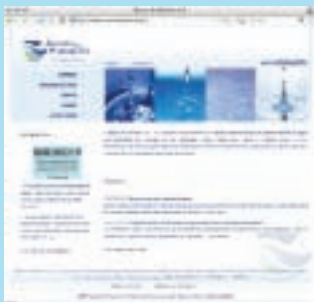
O site da Águas do Planalto