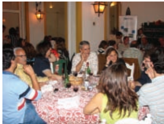
Durante o jantar