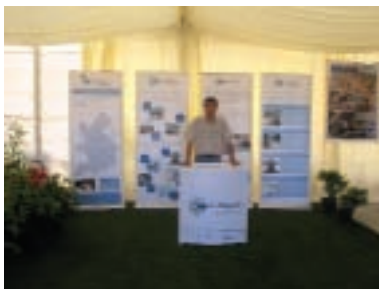
O espaço da Aquapor e da Luságua