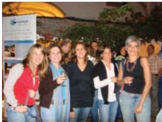
Antes do jantar