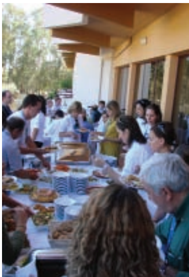
O almoço no 1º dia

Foram dois dias bem passados, em que todos contribuíram para o sucesso desta iniciativa. Na chegada ao hotel estava uma equipa de animadores à espera do grupo, que formou equipas, distribuiu t-shirts por todos e que explicou as actividades desse dia. Assim, a seguir ao almoço, teve lugar um pedipaper fotográfico pela cidade de Évora, que incluiu, para além de uma reportagem