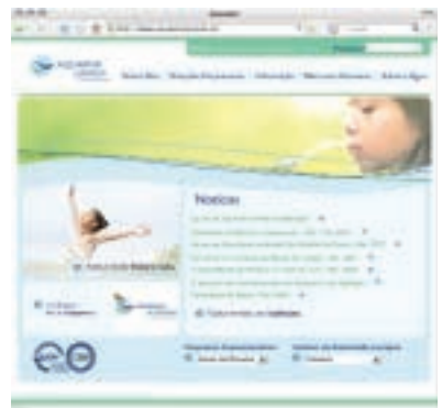
A nova página de abertura do site

As informações do site pretendem-se actualizadas, relevantes e precisas, e a navegação dentro do mesmo é simples e facilitada.