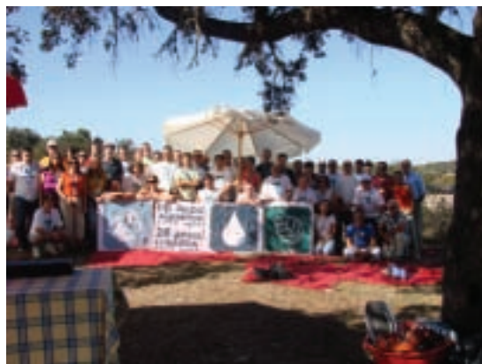
O final do encontro