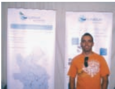
O apresentador do festival