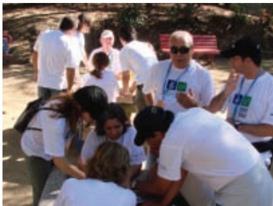
O início do pedipaper

Foi uma boa oportunidade para todos se conhecerem melhor, num ambiente descontraído e em que a participação e boa disposição de todos foram uma constante nestes dois dias bem passados.